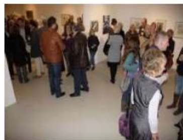
Besucher der Vernissage

(Klicken Sie auf ein Bild, um es zu vergrößern. JavaScript erforderlich.)