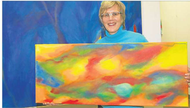
Bis Ende März sind die Werke von Claudia Volkner auf den Fluren des Arbeitsgerichts zu sehen.